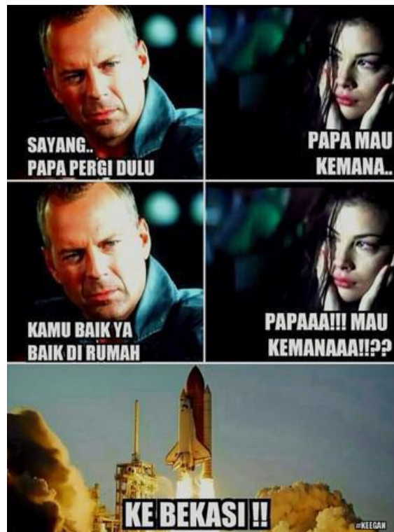
Gambar 2. Meme Kota Bekasi 2

Sekali lagi ada gambar meme yang menceritakan pasangan suami istri dengan dialognya: