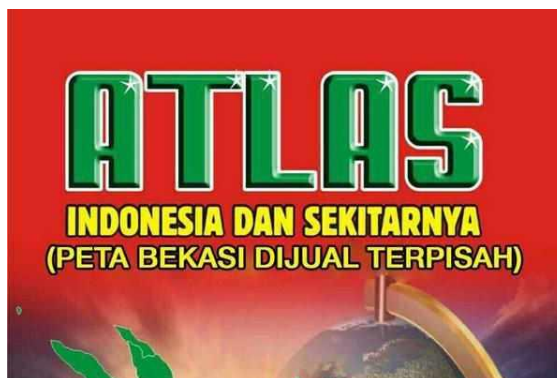
Gambar 3. Meme Kota Bekasi 3

“Atau mungkin karna jalanan dibekasi banyak yang rusak??? Cmiw (Correct me if i'm wrong)” Dengan bullyan seperti ini semoga Walikota Bekasi sadar dan mulai memperbaiki infrastuktur Kota Bekasi yang semrawut biar makin sedap dipandang.