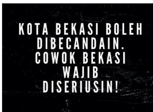
Gambar 4. Meme Kota Bekasi 4

“Atau mungkin karna jalanan dibekasi banyak yang rusak??? Cmiw (Correct me if i'm wrong)” Dengan bullyan seperti ini semoga Walikota Bekasi sadar dan mulai memperbaiki infrastuktur Kota Bekasi yang semrawut biar makin sedap dipandang.